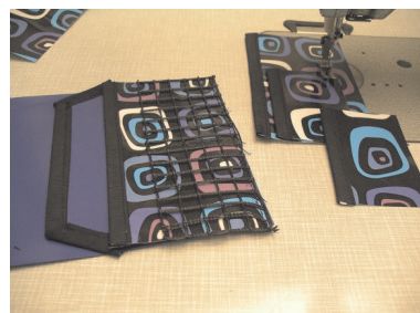
Taschen positionieren und fixieren