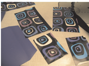
Bei allen Taschen Oberkante einfassen